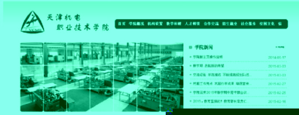
图 12-1-1 天津机电职业技术学院主页

1、登录学校主页天津机电职业技术学院 ( http://www.suoyuan.com.cn )